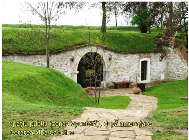
spațiu public (zona Caponieră), după amenajare Cetatea Albă Carolina

De asemenea, planul prevede continuarea proiectelor pilot de restaurare desfășurate în centre istorice (Alba Iulia, București) sau de reabilitare a spațiilor publice definitorii pentru diverse comunități (Sulina).