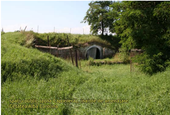
spațiu public (zona Caponieră), înainte de amenajare Cetatea Albă Carolina