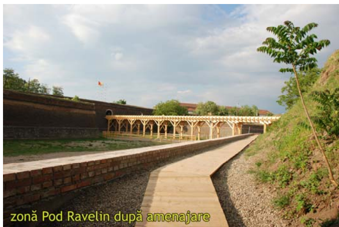
zonă Pod Ravelin după amenajare